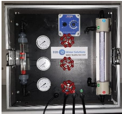
Mobiele testunit voor membranen